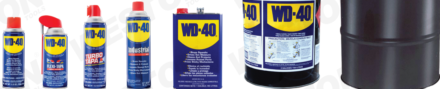
Lata de aerosol con válvula tradicional (3, 5.5, 8 y 11 oz)